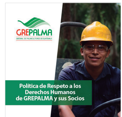
La Política de Respeto a los Derechos Humanos de GREPALMA y sus Socios;