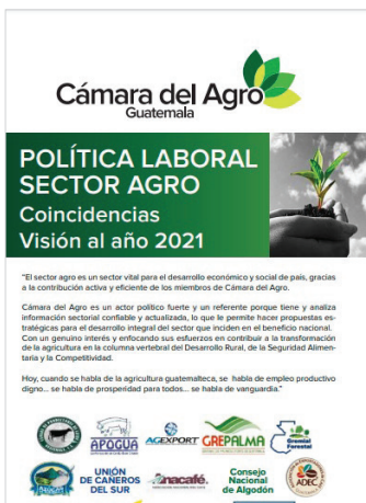
La Política Laboral de Cámara del Agro;

Para asegurar óptimas condiciones laborales, las empresas asociadas a GREPALMA han adoptado voluntariamente políticas y compromisos empresariales en materia laboral, siendo estos: